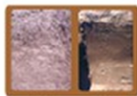
Textura de Cereales